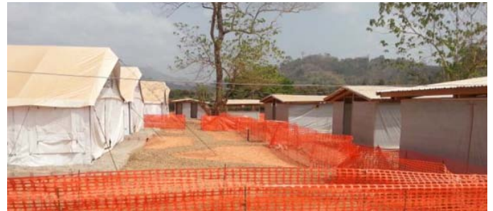
Une vue des tentes d'hospitalisation et des hangars du CTE