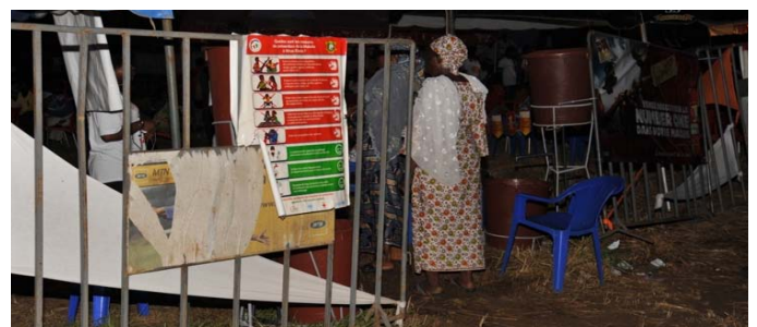
... par toutes les générations.

Remontez-nous toutes les informations en écrivant à info@cicg.gouv.ci ou appelez le 20 31 28 28