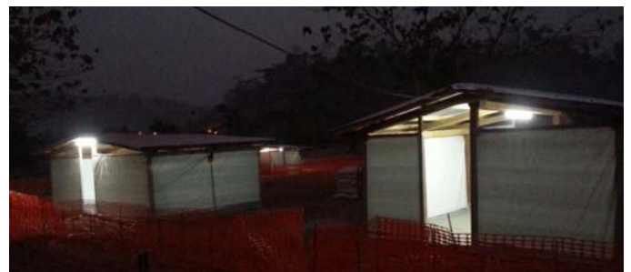
Le CTE éclairé la nuit