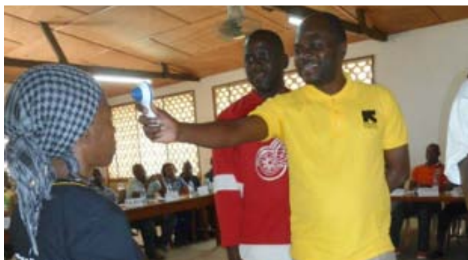
Les agents de santé en cas pratique ...