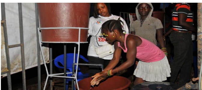
... est ici appliquée et respectée ...