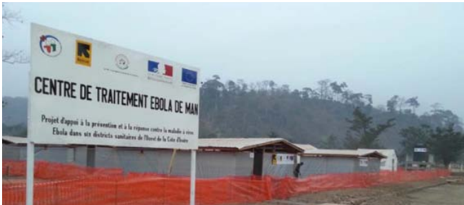
La pancarte de signalisation du CTE