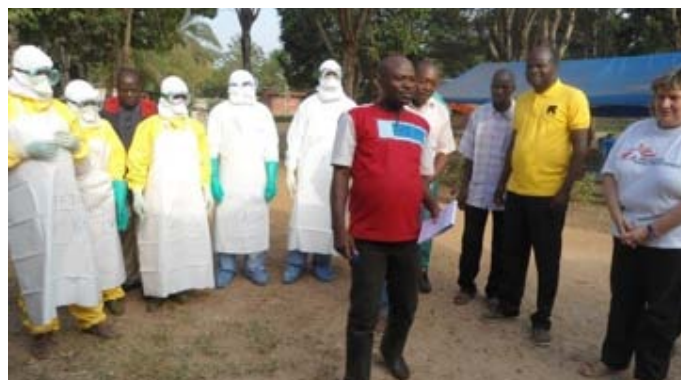
... au cours de la formation de Biankouma