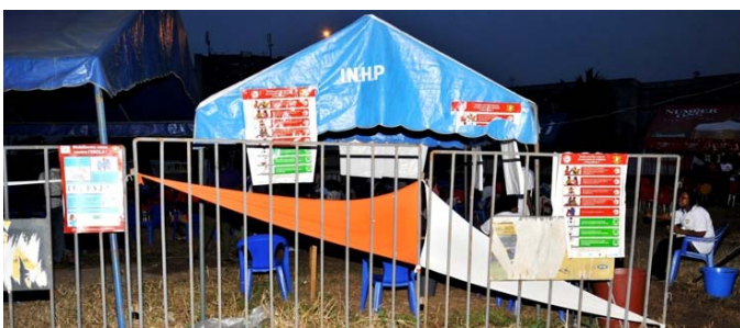
L'espace brandé avec les affiches de sensibilisation