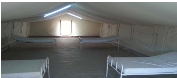
Vue d'intérieur d'une tente d'hospitalisation avec lits