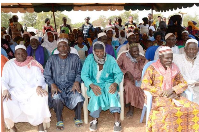
...et les chefs religieux s'est mobilisée accueillir la Ministre et sa délégation