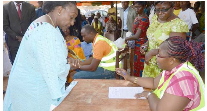
La ministre en a profité pour donner des conseils aux agents et à la population avant de prendre la direction de Nigouni