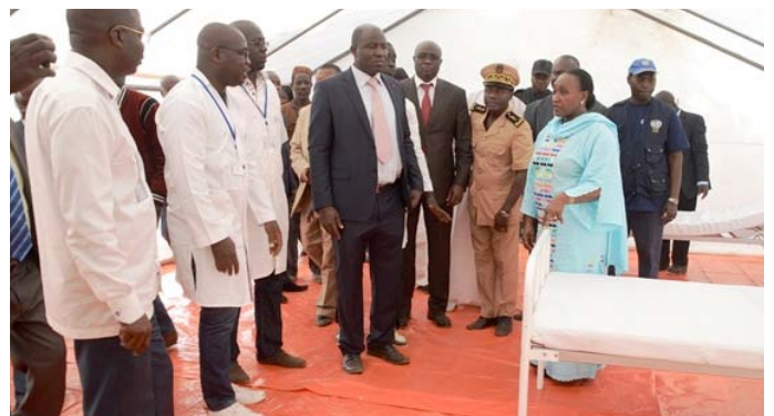
Visite du centre d'isolement de Nigouni