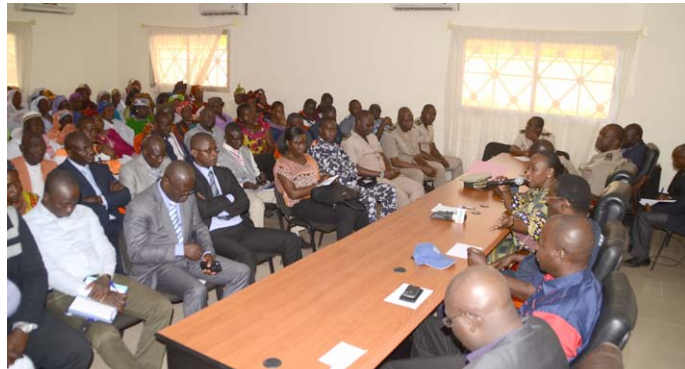
Elle a envoyé les femmes en mission de sensibilisation sur le phénomène des taxi motos