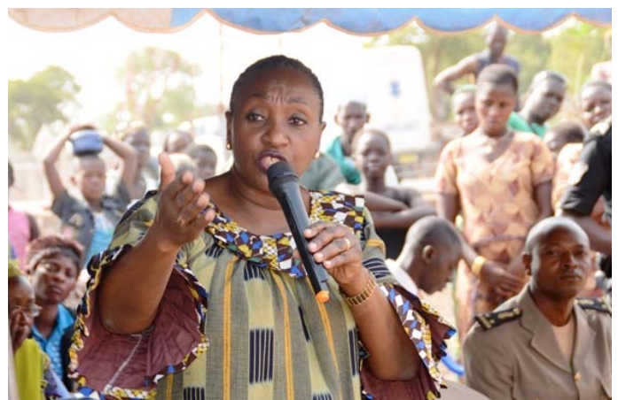
...et écouter son message de sensibilisation