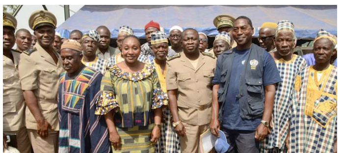
...qui est sortie massivement pour l'écouter