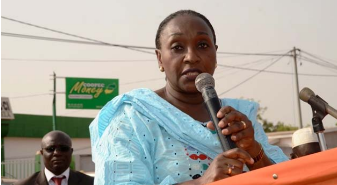
A tengrela le clou de cette première journée, elle a réitéré son message de sensibilisation