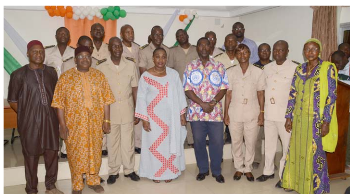
Madame la ministre s'est dit comblée de repartir car elle sait que les équipes travaillent sur le terrain.

▶ Remontez-nous toutes les informations en écrivant à info@cicg.gouv.ci ou appelez le 20 31 28 28