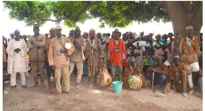
La Ministre a sensibilisé la population en expliquant les symptômes de la maladie, son mode de transmission et les mesures préventives