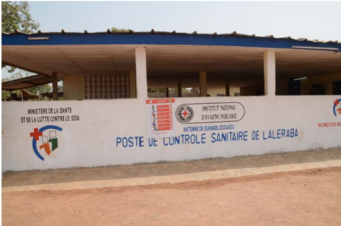
Bienvenue au poste avancé de Laleraba