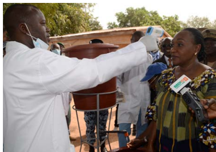
La ministre se fait prendre la température...