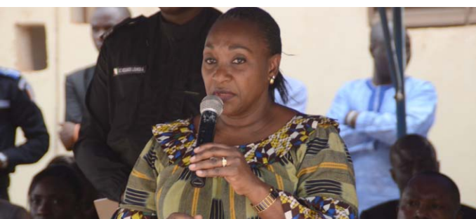
Pour clore sa visite à Pogo, La ministre s'est adressée à la population...