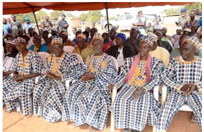
Toute la population avec à sa tête les chefs traditionnels...