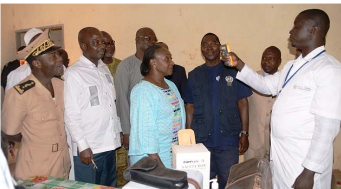
La Ministre à pu tester le bon fonctionnement du matériel