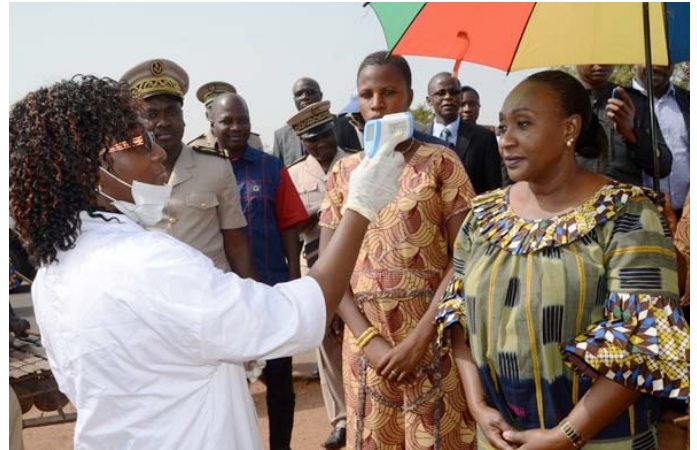
Respect des consignes oblige, la Ministre se fait prendre la température avec un thermomètre à infra rouge