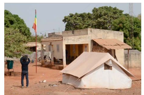
Dispositif mis en place par le Mali