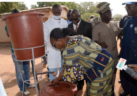
La mesure de lavage des mains est bien respectée