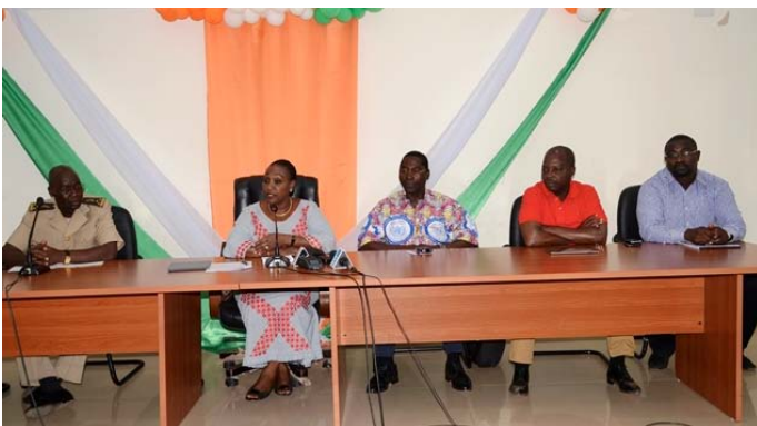
Pour clore sa tournée de sensibilisation...