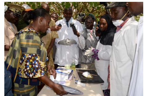
...et vérifie la bonne tenue du registre