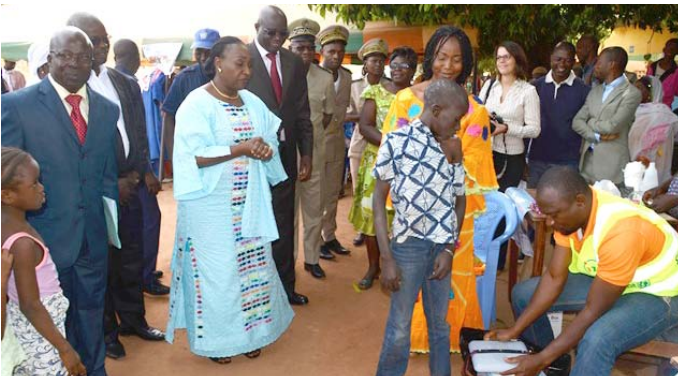
A son arrivée à Korhogo, Mme la ministre s'est rendue sur un site de vaccination contre la méningite