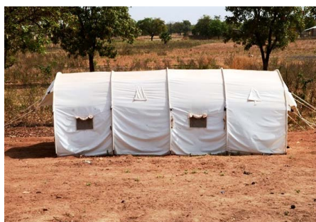
Le dispositif est prêt pour accueillir les cas suspects