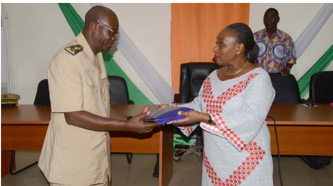
...les 10 préfets ont chacun reçu la somme de 1 million et les 48 sous préfet 300 000 FCFA chacun