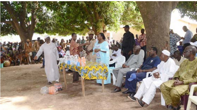
A Nigouni, village situé à 2 km de la frontière malienne