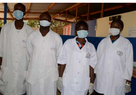
Les agents sont à leur poste et respectent les mesures de prévention