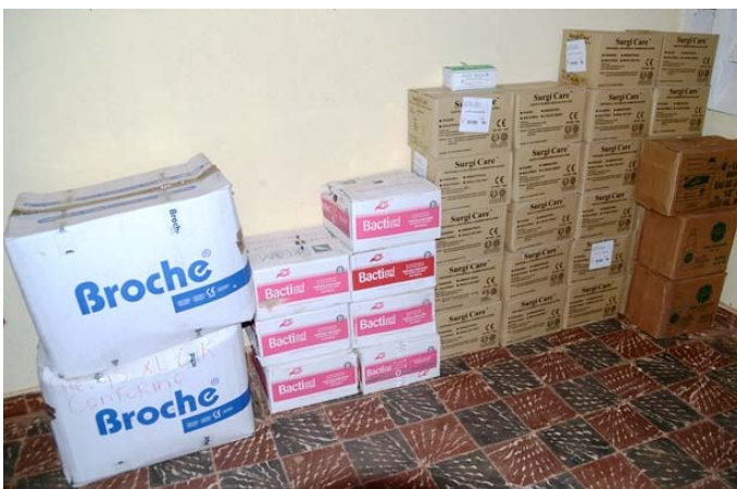
C'est un poste avancé bien équipé en matériels que la Ministre a pu découvrir