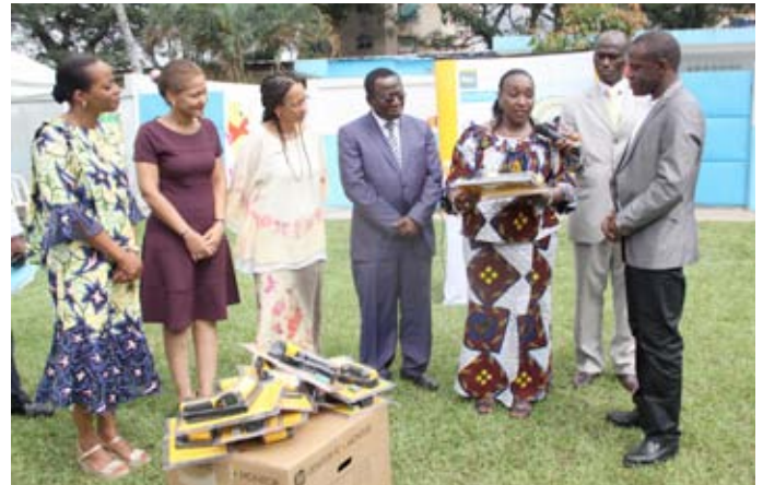
Le groupe SIFCA a offert 20 thermomètres infrarouge qui seront acheminés aux postes frontaliers