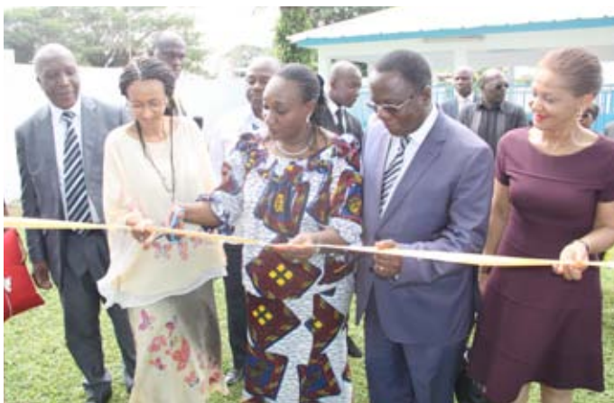
Coupure du ruban