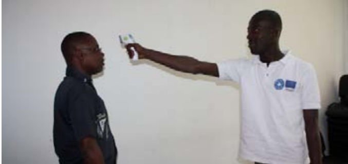
Les agents de la Nawa font une démonstration de la prise de température