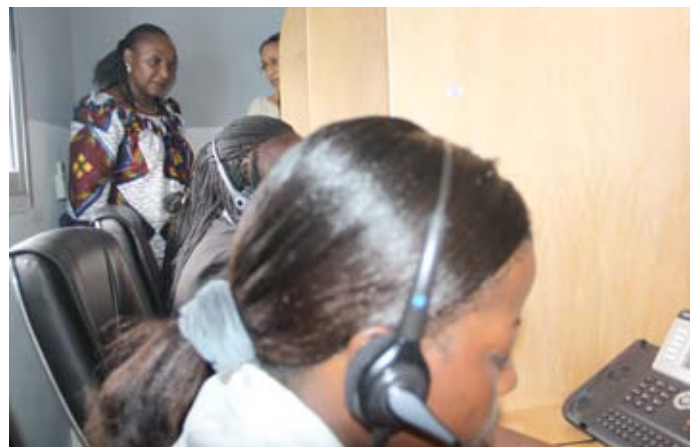
Les téléopérateurs en service ...