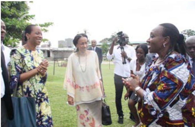
Arrivée de Madame la Ministre de la Santé et de la Lutte contre le SIDA