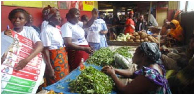
Les signes de la maladie expliqués aux commerçantes du marché d'Abobo ...