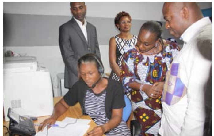
L'équipe des téléopérateurs a été renforcée par deux agents de l'INHP