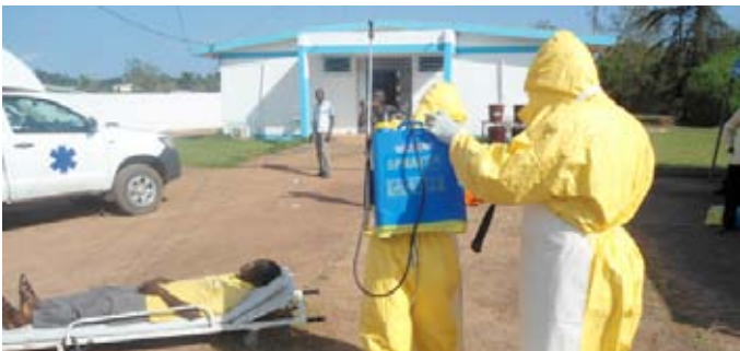
... d'un cas suspect