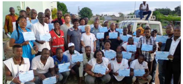
Photo de famille à la fin de la formation des agents de santé