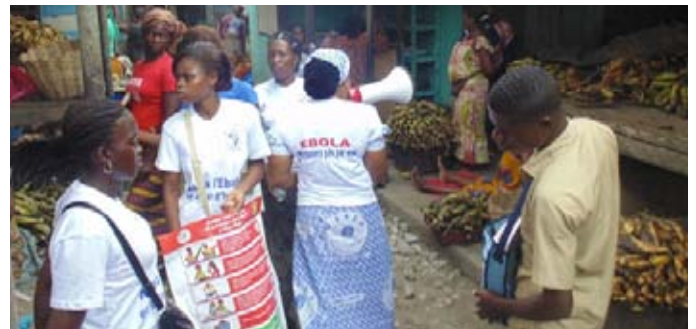
....ainsi qu'aux clients