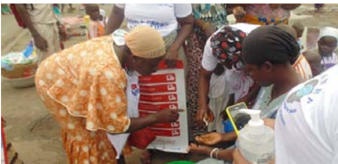
Les populations d'Abobo ont été invitées à appliquer les mesures préventives de lavage des mains