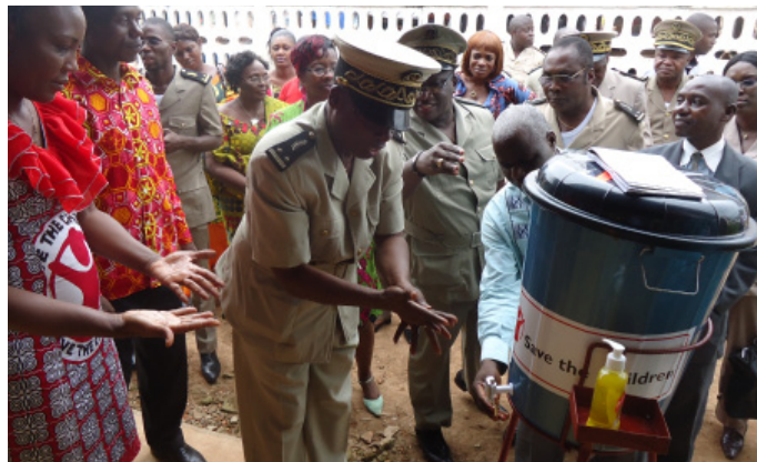
Save the children - Journée de lavage de mains avec les autorités d'Abengourou