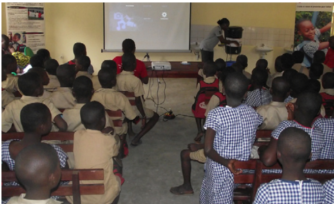
Save the children - Formation lavage des mains dans une école