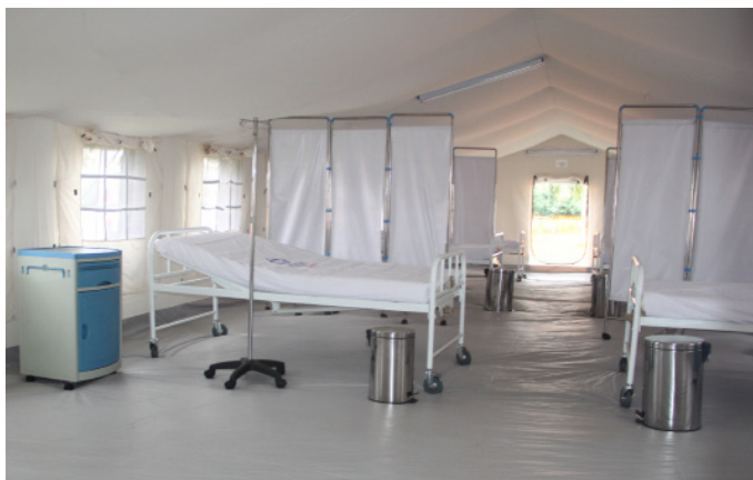
Une vue de l'intérieur d'une tente de prise en charge de cas