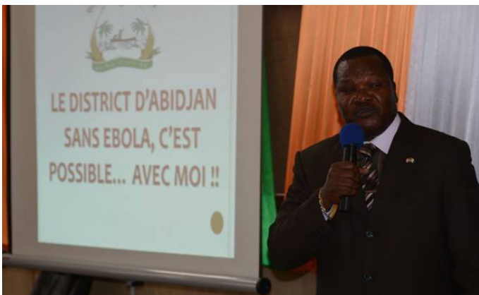
Séance de sensibilisation du District d'Abidjan