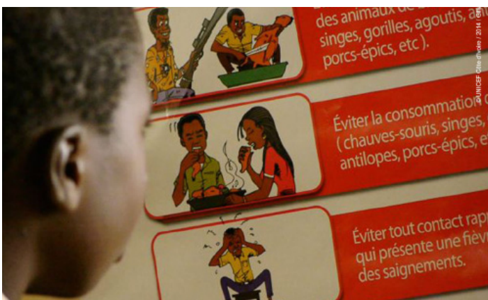
Sensibilisation dans les écoles par l'UNICEF