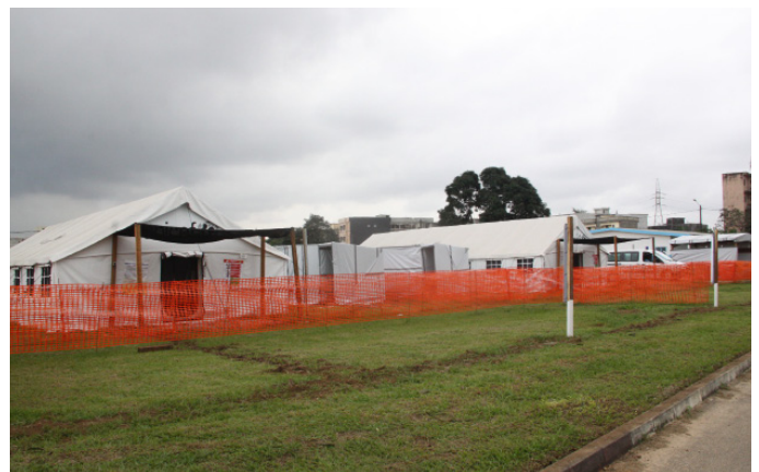
Vue de l'extérieur du CTE de Yopougon