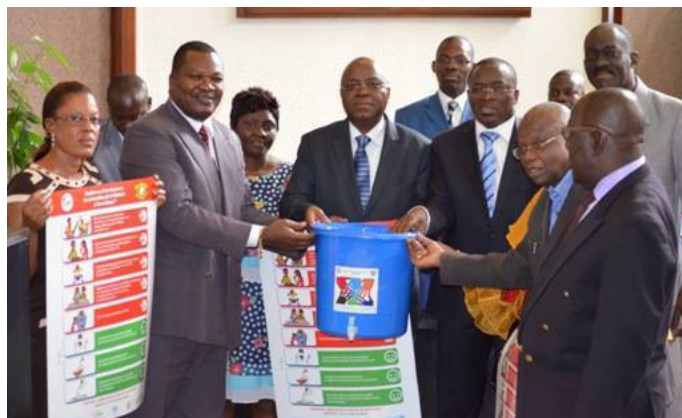
Remise de kit aux élus locaux du District Autonome d'Abidjan

Remontez-nous toutes les informations en écrivant à info@cicg.gouv.ci ou appelez le 20 31 28 28