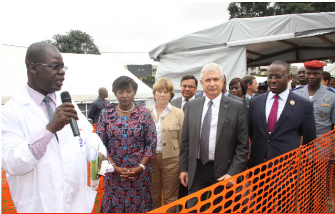
Présentation du CTE aux officiels