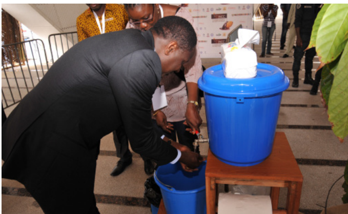
Application de la mesure du lavage des mains, lors des Journées Nationales du Café et du Cacao, avec le Ministre de l'agriculture ...