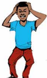
3. Maux de tête